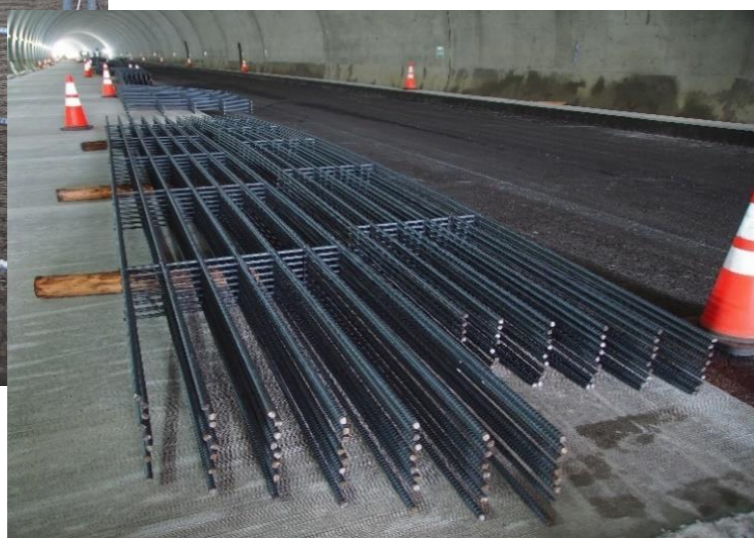
SKP主筋メッシュ SKPメッシュ工法としてNETIS登録品 (住倉鋼材㈱との共同開発品)