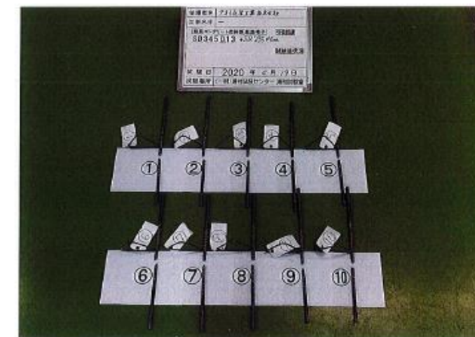
写真-2 試験後の状況